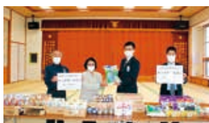
沖縄県労働金庫 名護支店様