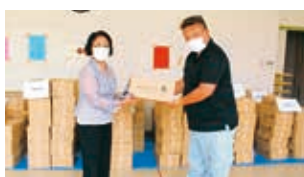
学生支援プロジェクト様 (ボランティア団体)