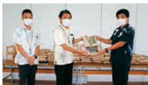
沖縄ハウスリゾート株式会社様