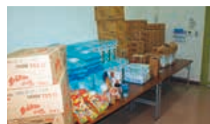
フードバンク セカンドハーベスト沖縄様