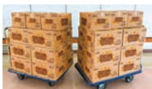
オリオンビール株式会社様